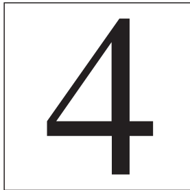
Abb. 1. Beispiel für ein kleines Bild, bei dem die Bildunterschrift neben der Abbildung platziert wird.

Kleinere Objekte können beliebig platziert werden (Abb. 1). Verwenden Sie dafür die Umgebungen \Sfigure und \Sctable aus dem sidecap -Paket. Der Text wird hierbei neben den Objekten oben bündig ausgerichtet.